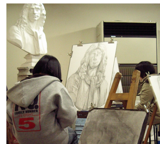
■千葉大学 教育学部 中学美術 現役合格(木更津高校)

【千葉大・筑波大・学芸大コース カリキュラム】 9:30～16:30 【美術系大学コース (B) カリキュラム】 9:30～16:30