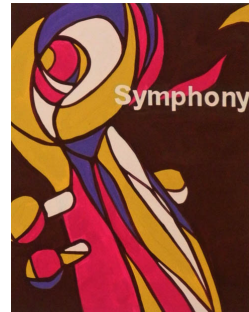
■多摩美術大学 グラフィックデザイン学科 現役合格(木更津高校)

【デザイン・工芸科コース カリキュラム】 (実技制作+講評) 9:30～17:00 (夜間補強課題+学科対策) 17:00～20:00 (模擬試験) 9:30～18:00